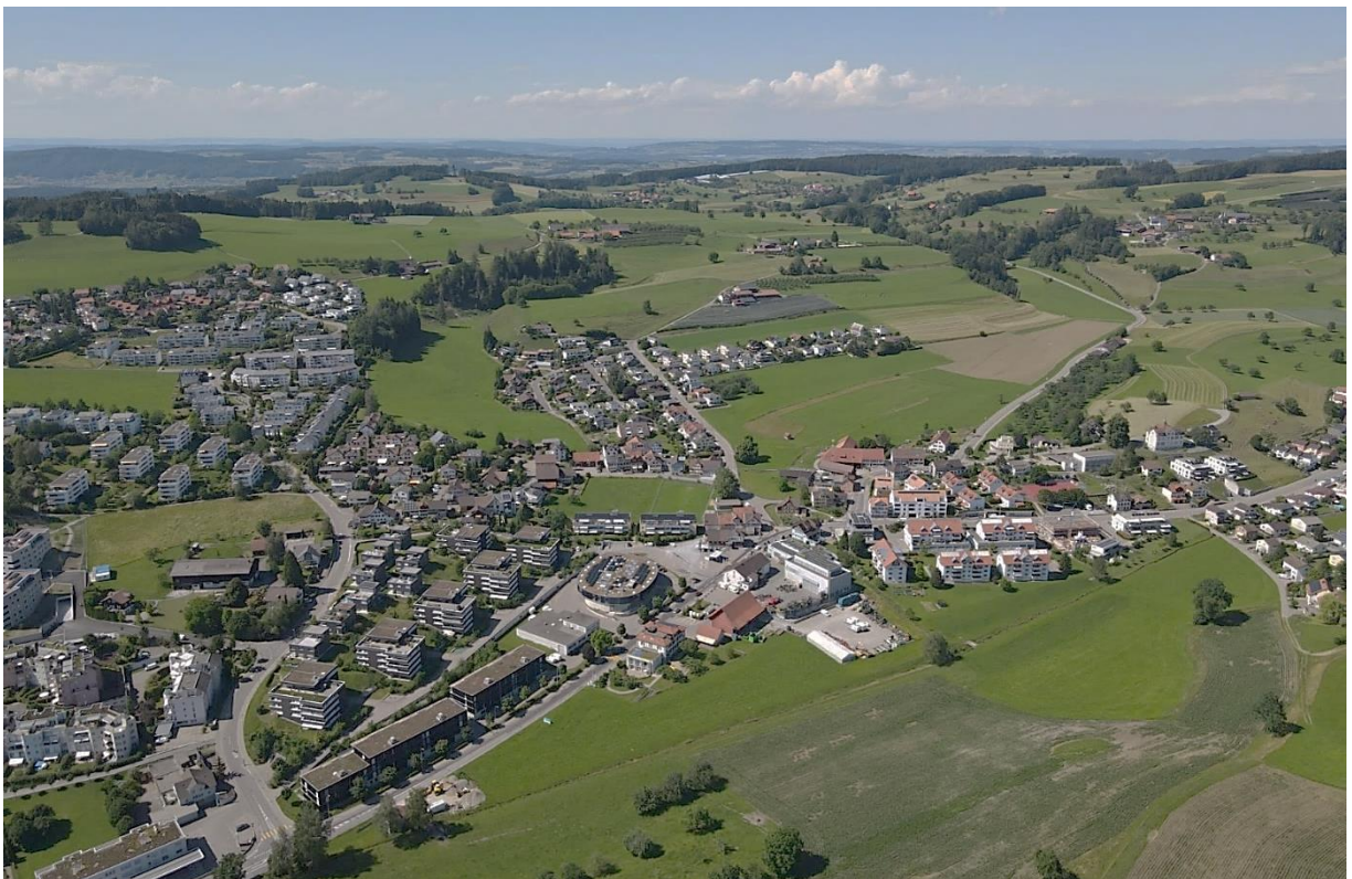
Rossrüti aus Postkartenperspektive im 2022